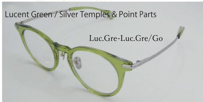
Lucent Green / Silver Temples & Point Parts

琥珀色のブラウン系大理石調フロントに、シルバーの飾りとテンブルの組合せ。落ち着いた深みのあるフロントカラーにシルバーメタルの輝きがカジュアルにより過ぎないシャープさを創ります。