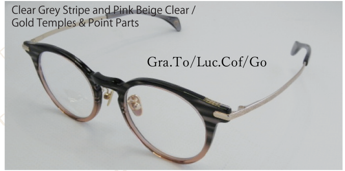
Clear Grey Stripe and Pink Beige Clear / Gold Temples & Point Parts

深みのあるべっ甲柄フロントに、ゴールドテンブルをプラス。高級感漂う王道の組み合わせです。