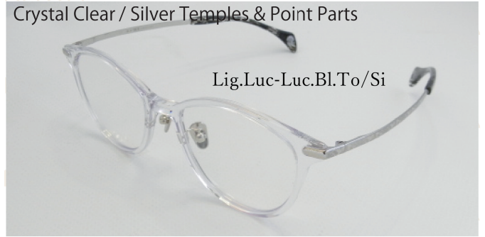
Crystal Clear / Silver Temples & Point Parts

クリアエローをベースに、美しいVバナ柄が溶け込むフロント。繊細な「胡蝶」の彫刻を施したゴールドテンブルと、目元を引き締めるフロント断面の飾り(Point Parts)が響き合い、身に着ける人の知性と優美な佇まいをスマートに惹き立てます。