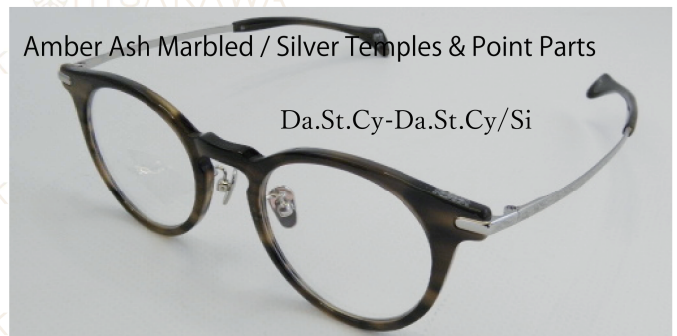
Amber Ash Marbled / Silver Temples & Point Parts

ピンクベージュのフロントに、ゴールドの飾りとガンメタルテンブルをプラス。透明ピンクの抜け感とガンメタルパーツの輝きでエレガントなモデルです。