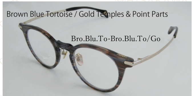
Brown Blue Tortoise / Gold Temples & Point Parts

くすみカラーを使ったスモークフロントにゴールドの飾りとガンメタルテンブル。抜け感と華やかさが、洗練された佇まいをスマートに惹き立てます。