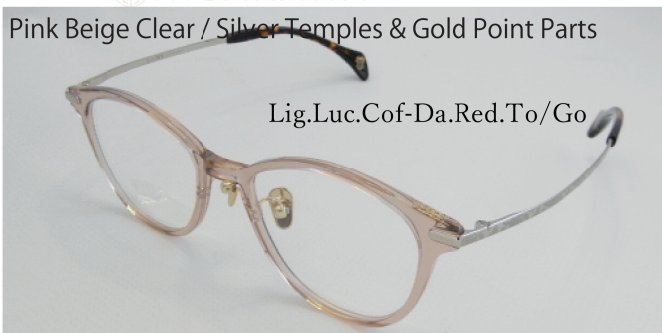
Pink Beige Clear / Silver Temples & Gold Point Parts

ピンクベージュのフロントに、目元を引き締めるゴールド飾り(Point Parts)とゴールドのテンブルパーツに上質な蝶の彫刻の輝き。ピンクの抜け感とゴールドメタルのコラボレーションが華やかさを演出します。