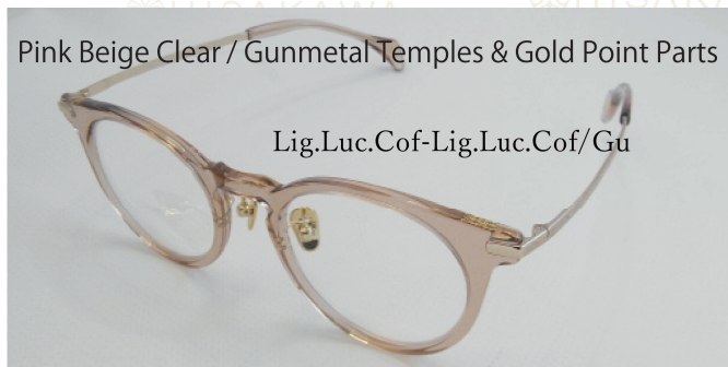
Pink Beige Clear / Gunmetal Temples & Gold Point Parts

ブラウンと知的なブルーが調和するササ柄のフロントに、ゴールドの装飾とテンブルをプラス。深みのあるカラーの存在感がゴールドメタルの輝きでエレガントに彩ります。