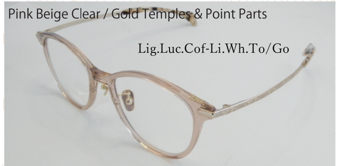
Pink Beige Clear / Gold Temples & Point Parts

アンバーの温かみのあるブラウンと、少しくすんだ「アッシュ」の深みが混ざり合った美しいグラデーションフロント。胡蝶のゴールドテンブルとフロントの飾り(Point Parts)が、都会的な大人の洗練された佇まいを表現します。