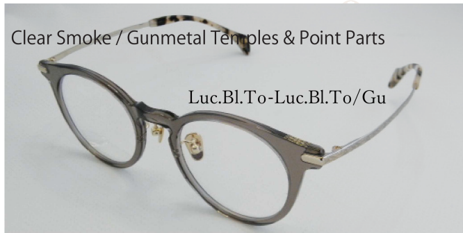
Clear Smoke / Gunmetal Temples & Point Parts

アンバーブラウンの温かさと、アッシュピンクが混ざり合った美しいグラデーションフロント。ゴールドテンブルとフロントの飾り(Point Parts)が、都会的な大人のラグジュアリーを飾ります。