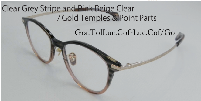
Clear Grey Stripe and Pink Beige Clear / Gold Temples & Point Parts

クリスタルクリアのフロント、彫刻を施したシルバーテンブルとフロント飾り(Point Parts)、全てがクールな世界観を演出します。