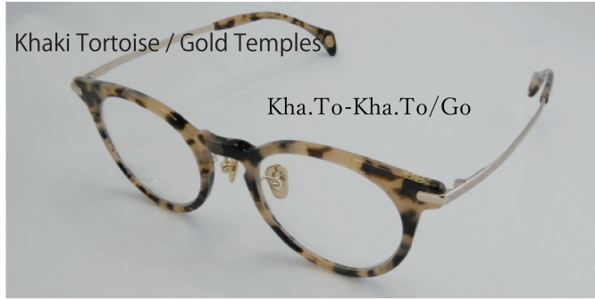
Khaki Tortoise / Gold Temples