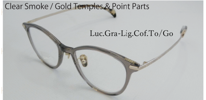
Clear Smoke / Gold Temples & Point Parts

ピンクベージュのフロントに、胡蝶の彫刻をしたシルバーテンブル、目元を引き締めるゴールドの断面飾り(Point Parts)をプラス。ピンクの透明感が美しく「抜け感」と上質なメタルパーツの輝きがエレガントに演出します。