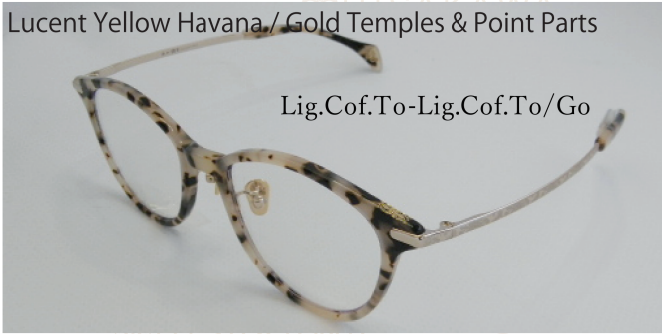
Lucent Yellow Havana / Gold Temples & Point Parts